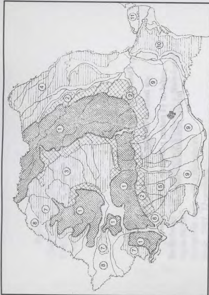
Unitățile regionale ale României